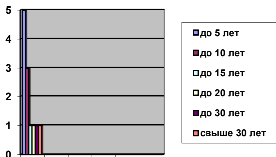
Стаж работы кадров

2 педагога молодые специалисты (стаж работы менее 2-х лет).